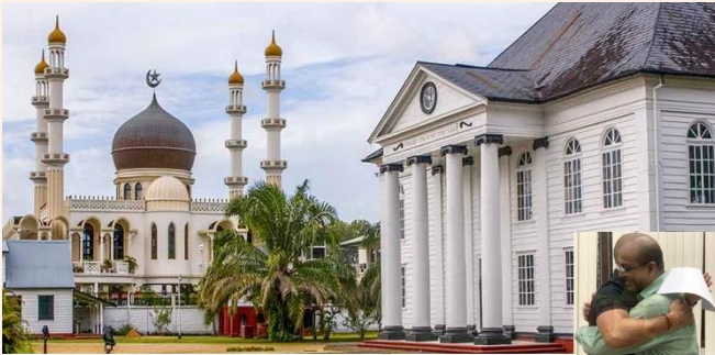
MEZQUITA Y SINAGOGA CODO CON CODO EN PARAMARIBO ICONO DE PAZ, TOLERANCIA Y RESPETO EN EL MUNDO DESDE 1932

Con 91 años de buena vecindad entre nues- tras casas de culto adyacentes, ofrecemos al mundo un ejemplo de cómo las religiones y sus organizaciones pueden coexistir pacífica- mente sin comprometer sus identidades